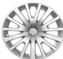
Radkappe MILFORD 15" (Optionscode DZJM)