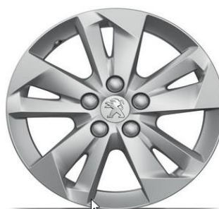
Leichtmetallfelge TARANAKI 16" (Optionscode DZSB)