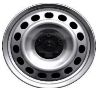
Radkappe CABOCHON 16"